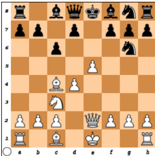
Stelling na 8.De2 (analyse)

Goed genoeg, maar sterker was 5...Pg6 6.e5 Pg8 7.Lc4 c6 8.De2 Zie diagram 2