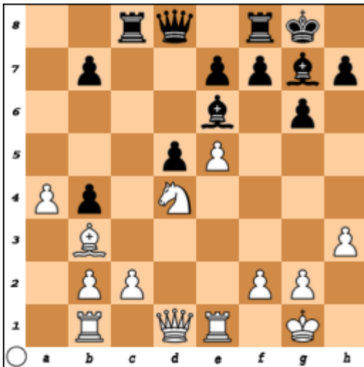
Stelling na 17...Le6