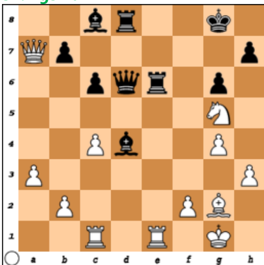
Stelling na 31...Ld4