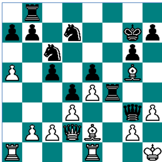
Stelling na 22...Tf4?!

21...Dg3 22.Dd2 Tf4?! Om tegenspel te creëren, maar hoe werkt 22...Tf2 uit? (Na 22...Tf2!? volgt 23.Lh6+ Kh8 24.Dg5 Dxg5 25.Lxg5 met iets beter spel voor wit, red).